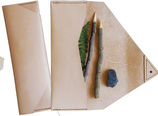
2. lore + needles